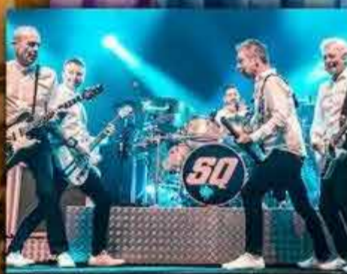
STATUS QUO 14 JUNIO