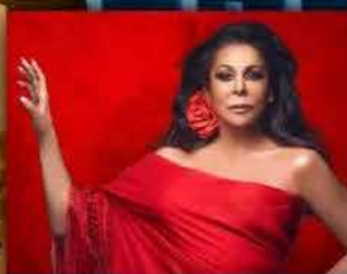
ISABEL PANTOJA 1 JUNIO