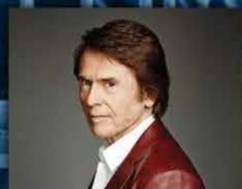
RAPHAEL 2 JUNIO