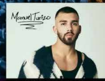
MANUEL TURIZO ARTISTA INVITADA LENNIS RODRÍGUEZ 14 SEPTIEMBRE