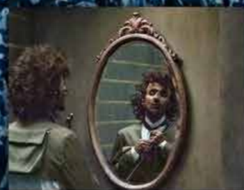
ARA MALIKIAN 8 SEPTIEMBRE