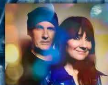
AMARAL 7 JUNIO