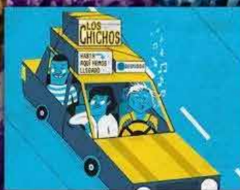
LOS CHICHOS 1 SEPTIEMBRE