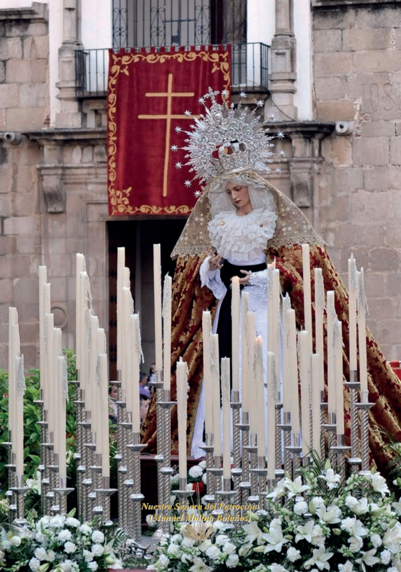
Nuestra Señora del Patrocinio (Mannel Molina Bolaños)