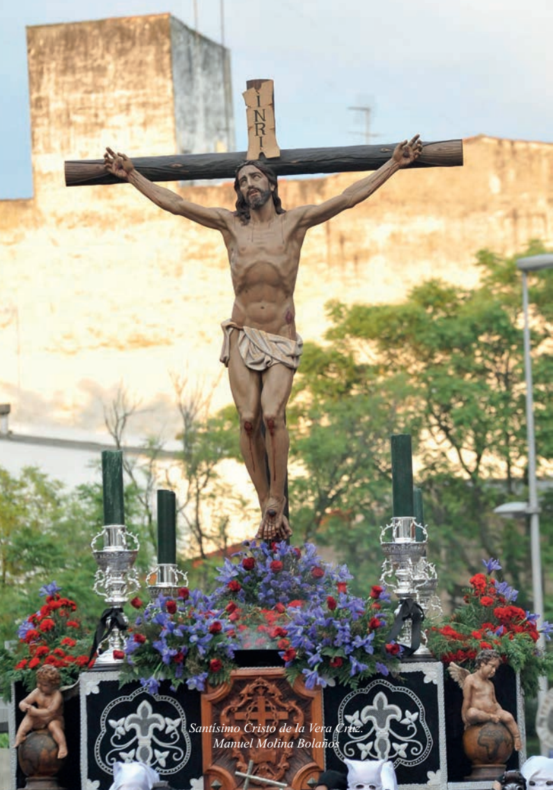
Santisimo Cristo de la Vera Cruz. Manuel Molina Bolaños