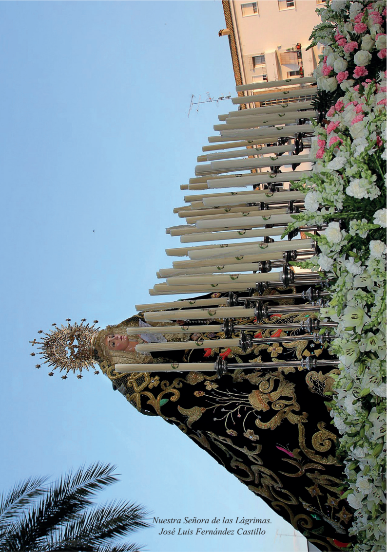
Nuestra Señora de las Lágrimas. José Luis Fernández Castillo