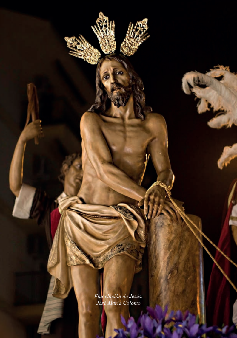
Flagelación de Jesús. José María Colomo