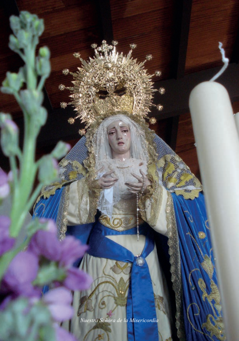
Nuestra Señora de la Misericordia