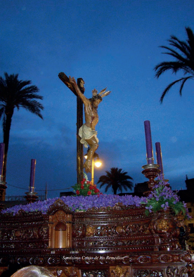
Santísimo Cristo de los Remedios