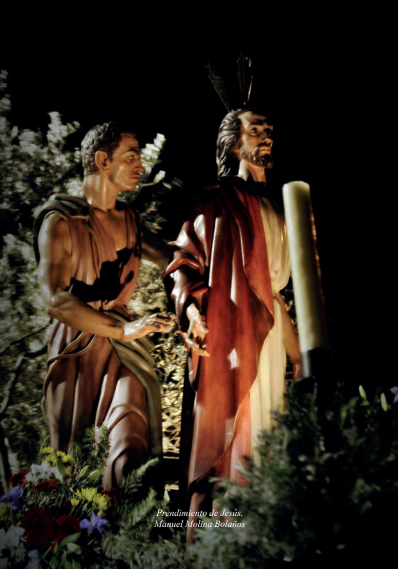
Prendimiento de Jesús. Manuel Molina Bolaños