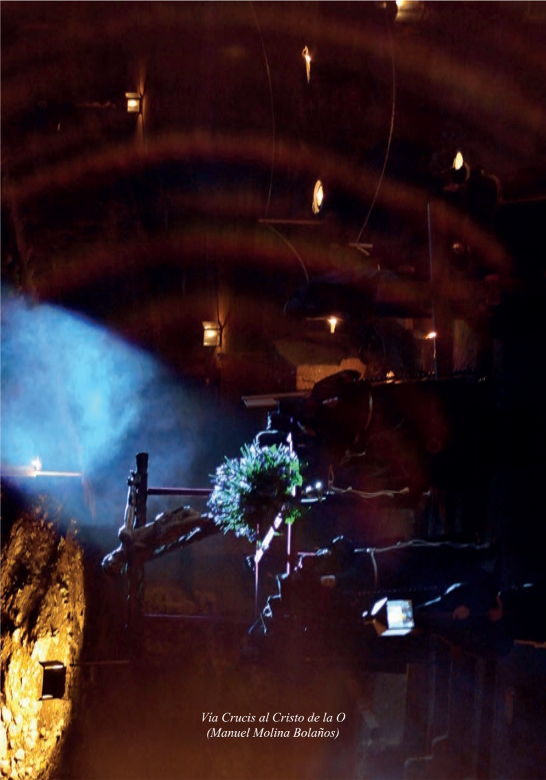
Via Crucis al Cristo de la O (Manuel Molina Bolaños)