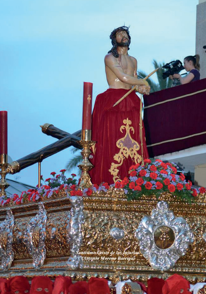
Santisimo Cristo de las Injurias. (Antonio Moreno Barriaga)