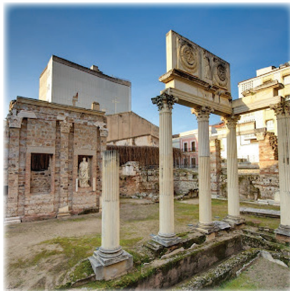
Pórtico del Foro