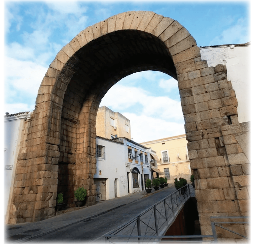
Arco de Trajano