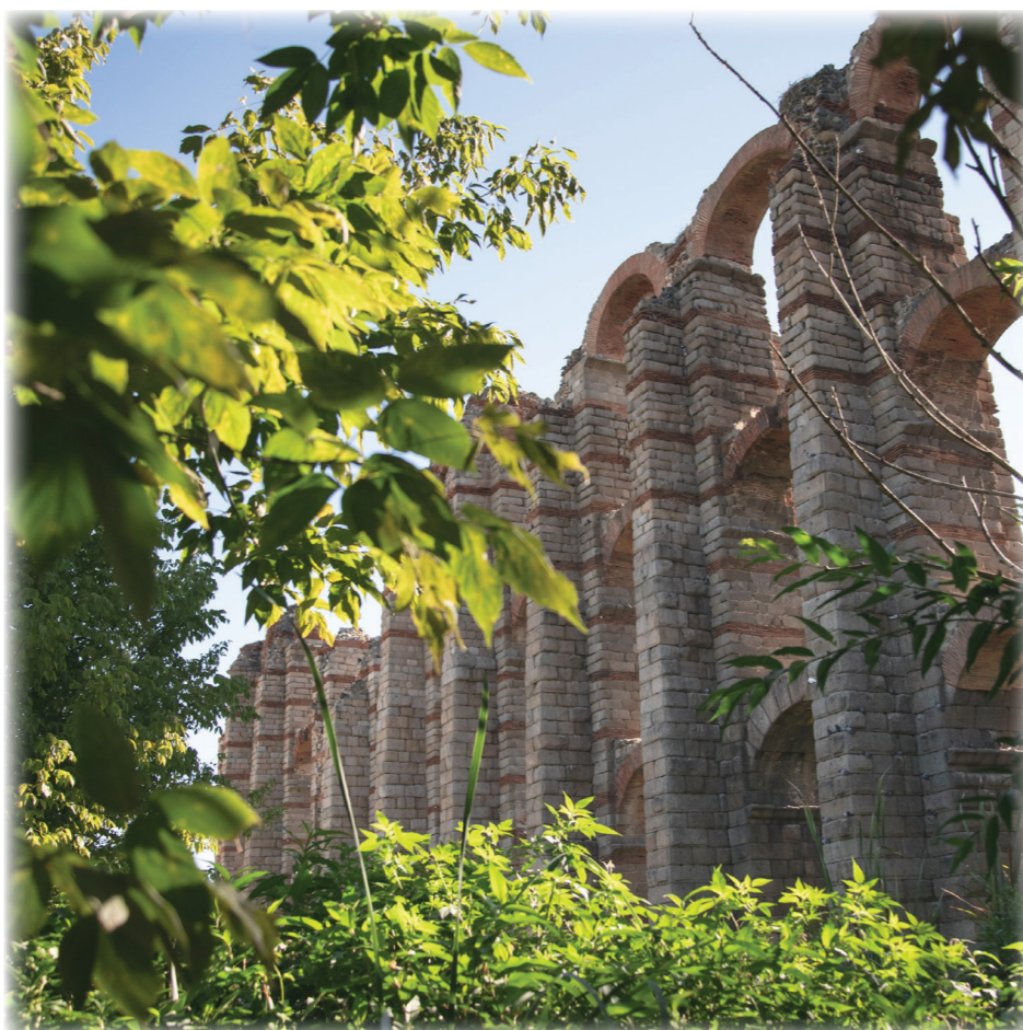
Acueducto de los Milagros