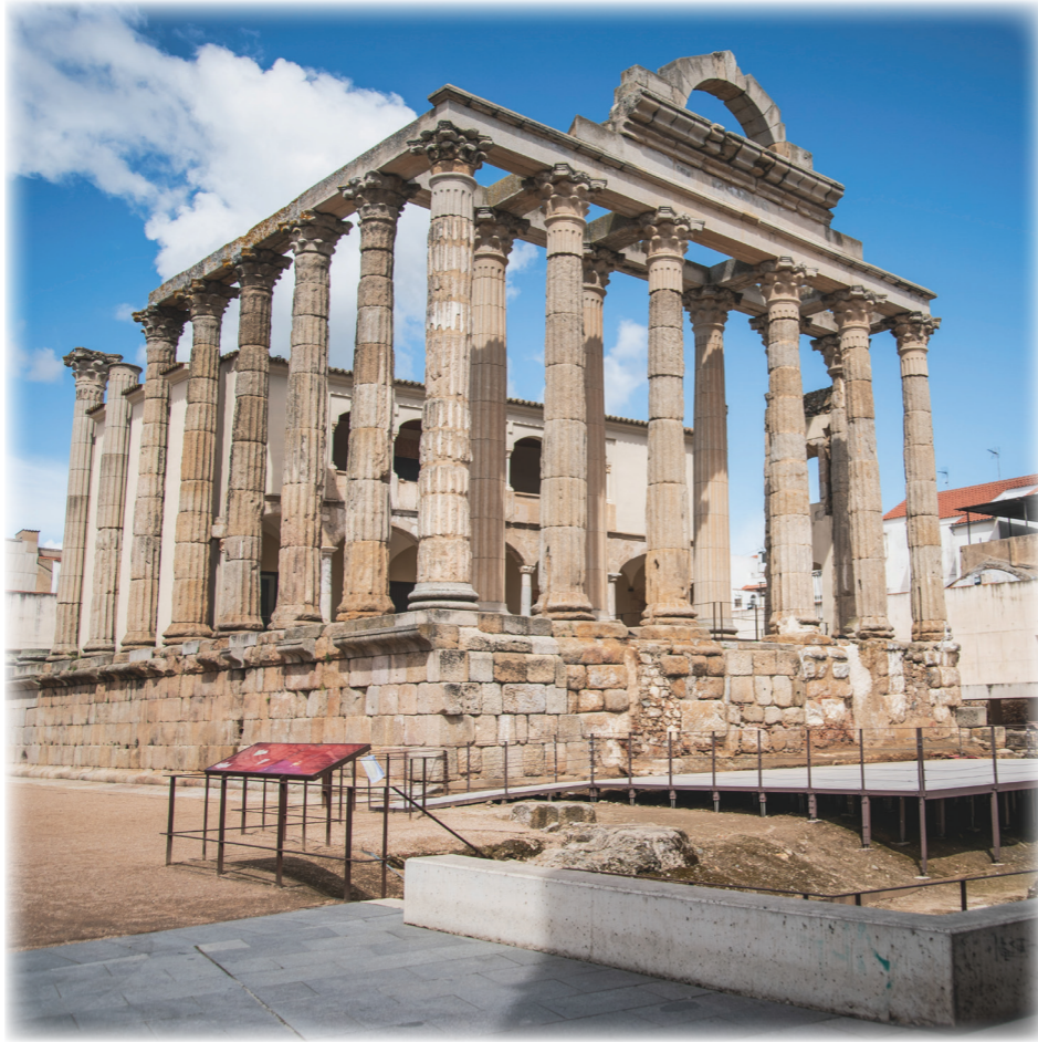
Templo de Diana

Podrás visitar los siguientes monumentos al aire libre: